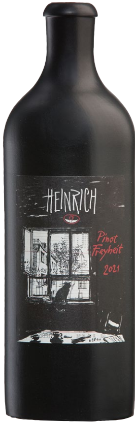
Heinrich Pinot Noir Freyheit 2022, Østrig ÖSTERREICH | 275 KR.

Fra bakkerne i Leithagebirge. En uges maceration på skallerne, før spontan gæring og otte måneder på amfora. Ingen svovltilsætning. Lys og let, nærmest som en rosé. Røde bær, kølige krydderier og meget imødekommende. En spændende vin i sin helt egen stil. Alk.: 12% 94