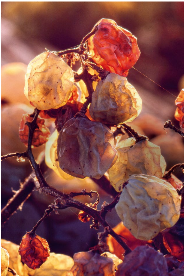
Druer ramt af botrytis

Selvom området for de fleste vil være ukendt, er det et af verdens ældste vinområder, og det ligger på de østvendte skråninger af den lille bjergkæde Leithagebirge. Fund af druekerner fra en keltisk grav fra cirka år 800 før Kristi fødsel viser, at man allerede producerede vin i dette område før mange andre anerkendte vinområder.